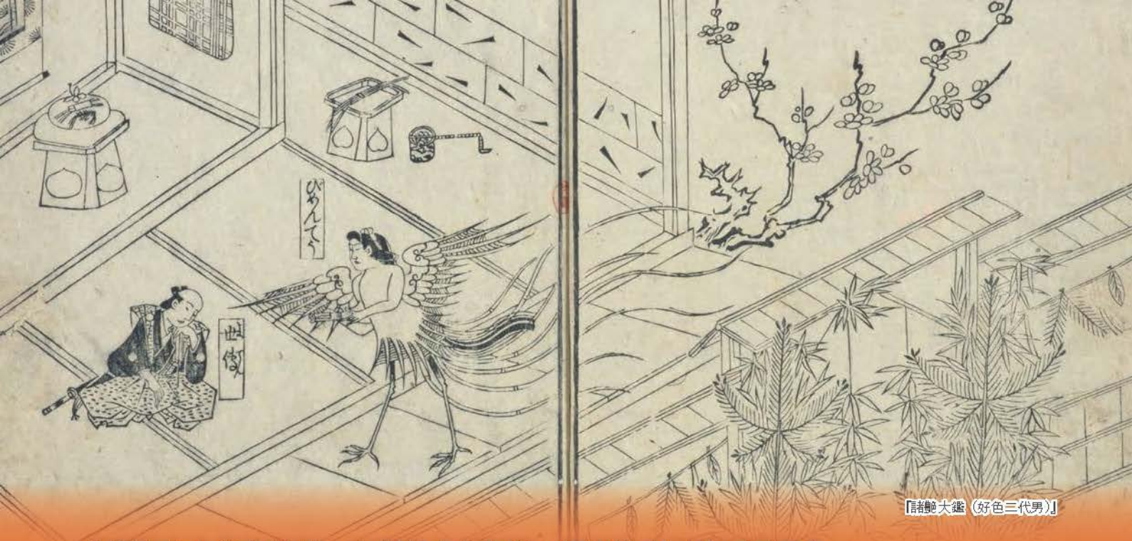
『繪本大鑑（好色三代男）』