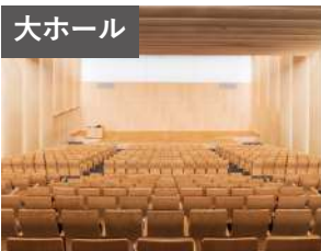
大ホール 収容人数:484席(固定481席、車いす3席) 延床面積:510.63㎡

当館には講演会やセミナーなど、多岐にわたってご利用いただけるホールがございます。(Wi-Fi設備あり)お気軽にお問い合わせください。