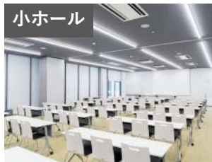
小ホール 収容人数:可動席100席 延床面積:198.84㎡