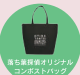
落ち葉探偵オリジナル コンポストバッグ