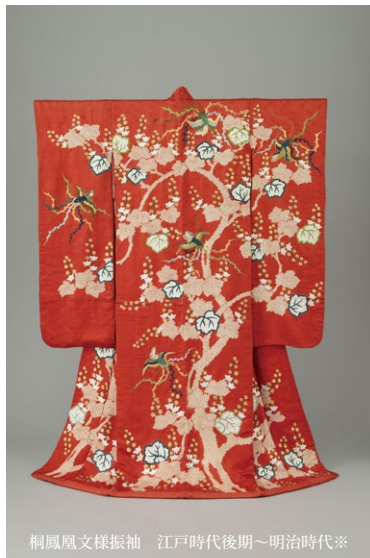
桐鳳凰文様振袖 江戸時代後期～明治時代※