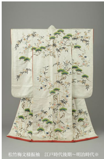
松竹梅文様振袖 江戸時代後期～明治時代※