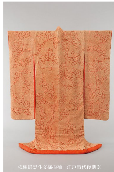
梅樹蝶熨斗文様振袖 江戸時代後期※ ※いずれも京都府蔵（京都文化博物館管理）