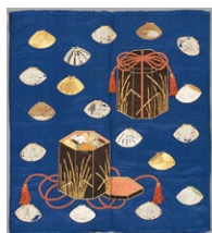
貝桶文様裾紗 江戸時代後期※

人生の晴れの日を彩る婚礼衣装は、いつの時代にも最高の手仕事により、心を込めてあつらえられました。気の遠くなるような細かい鹿子絞がびっしりとほどこされた振袖や、さまざまな吉祥文様があらわされた打掛、つややかな刺繍でいどられた袱紗といった婚礼に関わる染織文化財は、人々の心の高揚をいまに伝えてくれるとともに、日本の染織文化の、華やかさと高貴さをかねそなえた特質を体现しているともいえます。