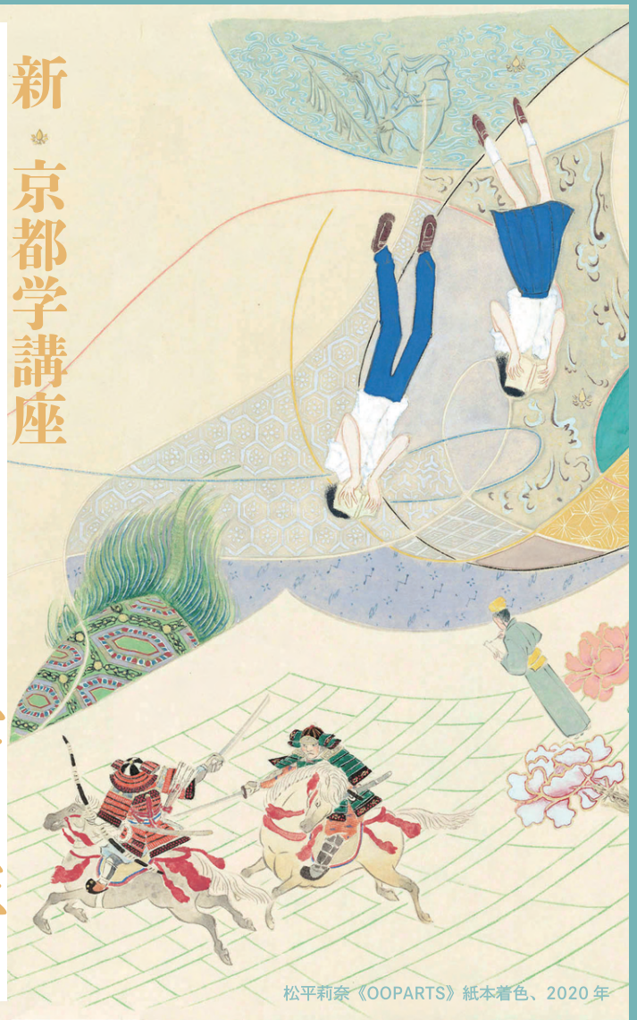
松平莉奈《OOPARTS》紙本着色、2020年