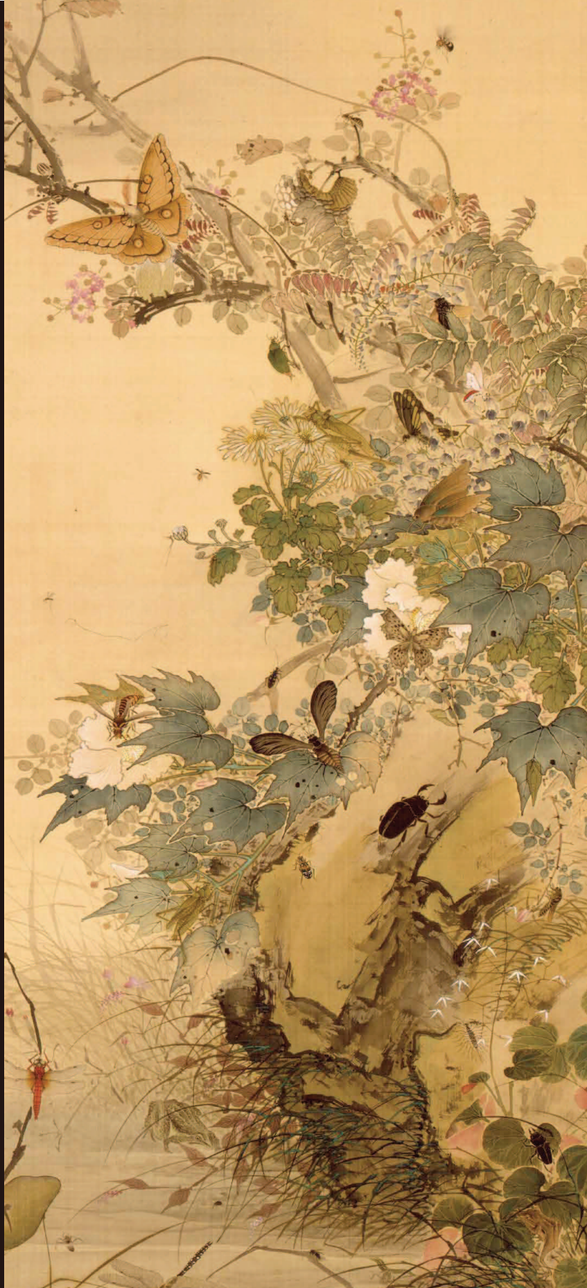
今尾景年《群芳百蟲図 (四時花木群蟲図)》(部分) 1885年