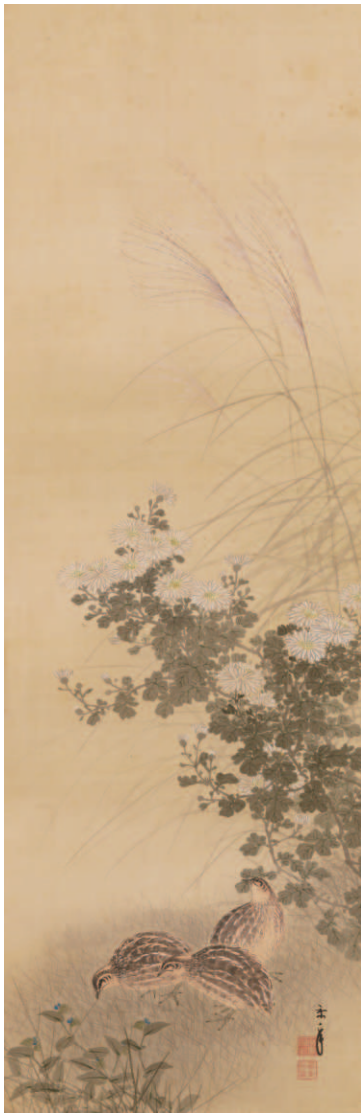
今尾景年《秋野群鶉図》1912年